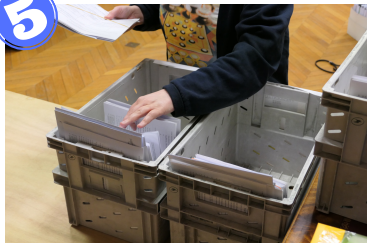
Tri des procès-verbaux par commune