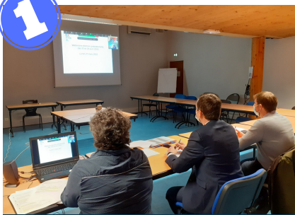
Webinaire de préparation aux élections présidentielles avec les maires de l'Aube