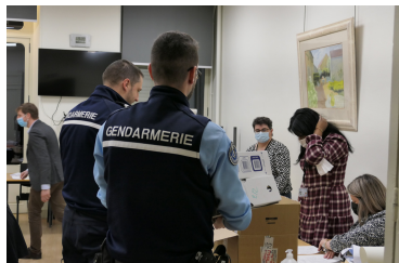
Dépôt des procès-verbaux par les gendarmes et les policiers municipaux