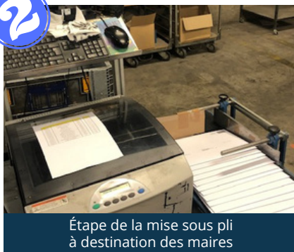
Étape de la mise sous pli à destination des maires