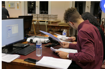
Vérification des procès-verbaux