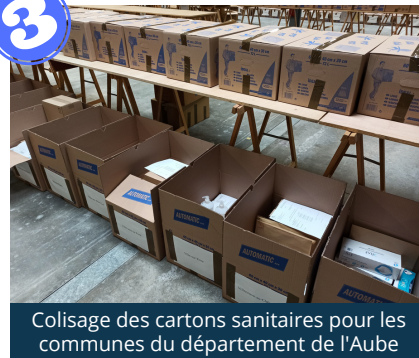
Colisage des cartons sanitaires pour les communes du département de l'Aube