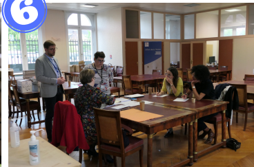
Commission de contrôle des résultats