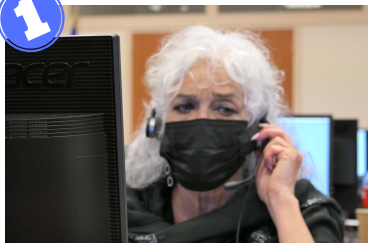
Réception des résultats