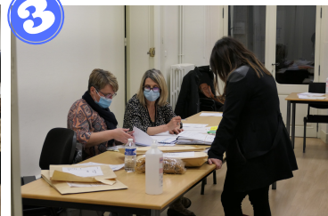
Pointage des procès-verbaux